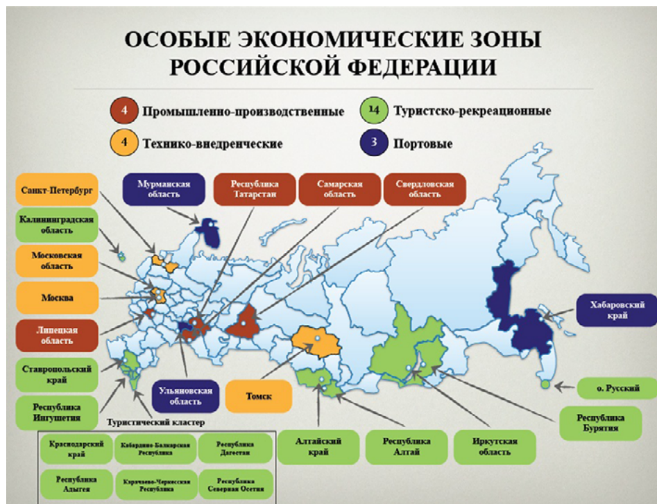
Рис. 1. Особые экономические зоны в России [5]

и логистики, начавшимся сразу после распада СССР. В настоящее время этот сектор ОЭЗ представлен ОЭЗ «Ульяновск» (Ульяновская область) и ОЭЗ «Оля» (Астраханская область) [4].